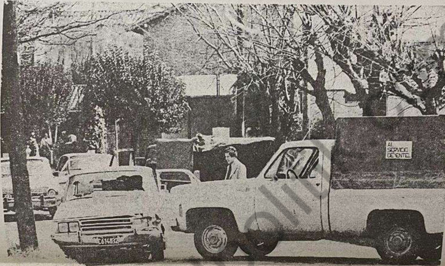
La camioneta de los secuestradores, aún junto al automóvil en que viajaban las víctimas del operativo, al que chocó